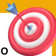
Figura 1: CALENDÁRIO DE PLANEJAMENTO SEMANAL DIDÁTICO-PEDAGÓGICO

Proposta para orientar o planejamento pedagógico semanal: